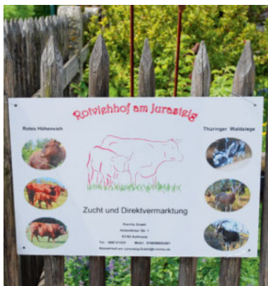
Schon am Hoftor werden Besucher auf die Zucht und Vermarktung aufmerksam gemacht.