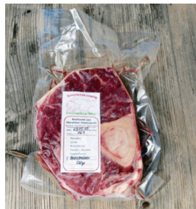
Das Rindfleisch wird handlich vakuumiert in küchenfertigen Portionen angeboten.